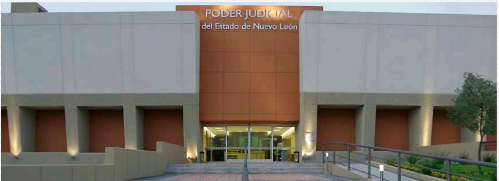
Palacio de Justicia (Cadereyta Jiménez, NL)

Nowadays, deriving from its experience and organizational structure, GP Desarrollos has advanced into infrastructure projects under PPS, concession and lease acquisition schemes.