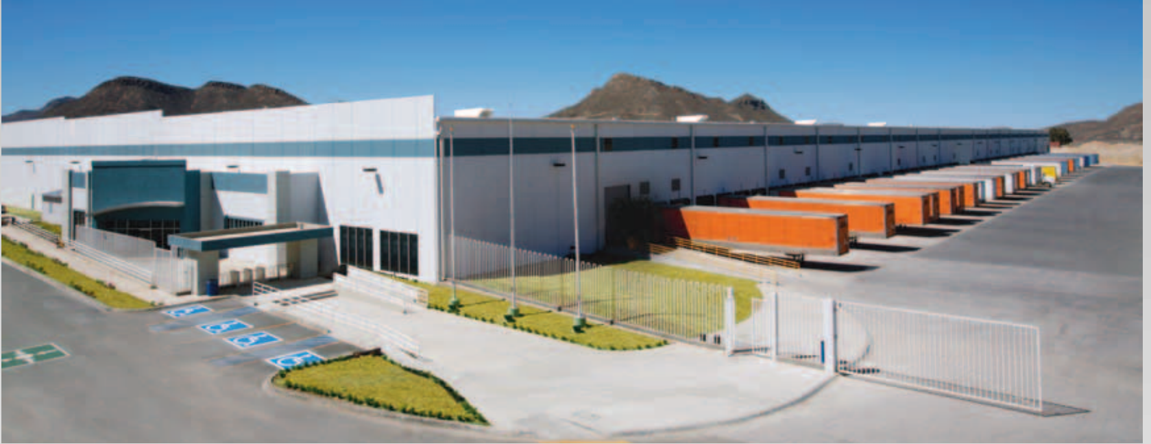
Centro de Distribución Whirlpool (Ramos Arizpe, Coahuila)