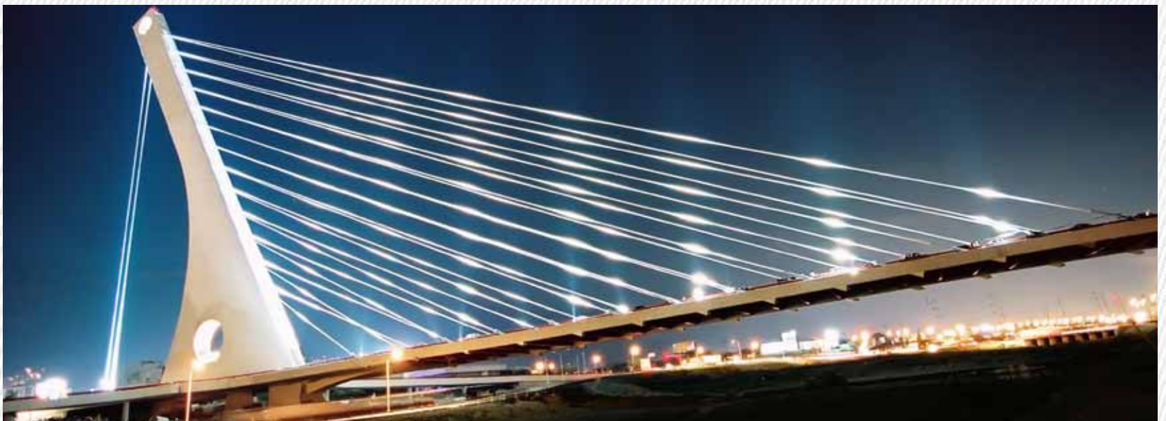
Puente La Unidad (Monterrey, N. L.)

This business unit's participation in several projects across Mexico has helped to consolidate its growth and hence diversify its structural organization. With this, GP Construcción has the capacity to operate at any point of the country and any kind of complexity, maintaining its unique approach to customer service, during and after each project.