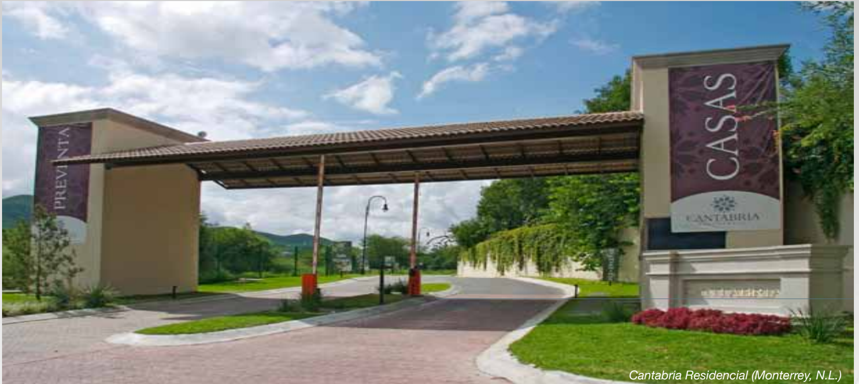
Cantabria Residencial (Monterrey, N.L.)

Una de las empresas más jóvenes de Grupo GP, dedicada a la conceptualización y comercialización de vivienda residencial principalmente en el Área Metropolitana de Monterrey, así como en las ciudades de Guadalajara y Reynosa.