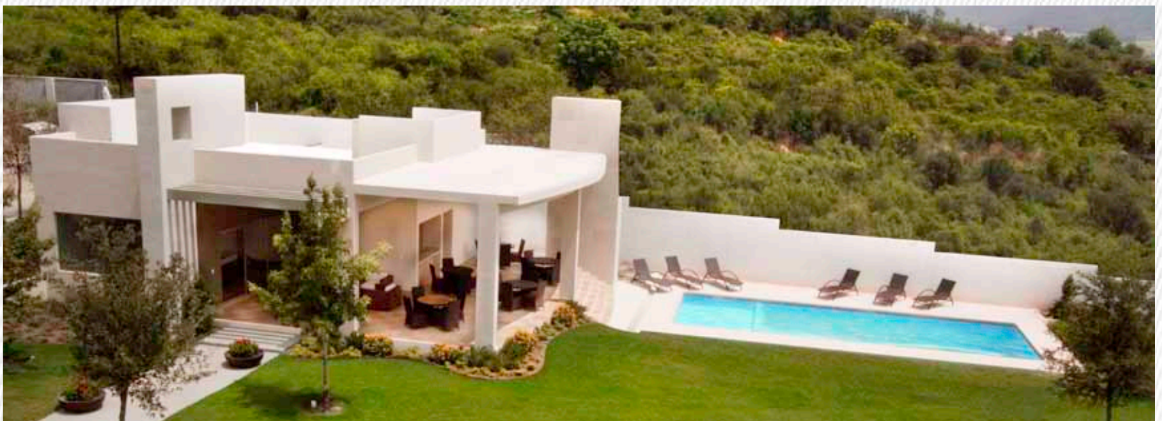
Soria. Comunidad de 40 Residencias

The brand's developments are designed to create a unique experience that offers avant-garde architectural concepts and privacy to create a harmonious and secure urban environment.