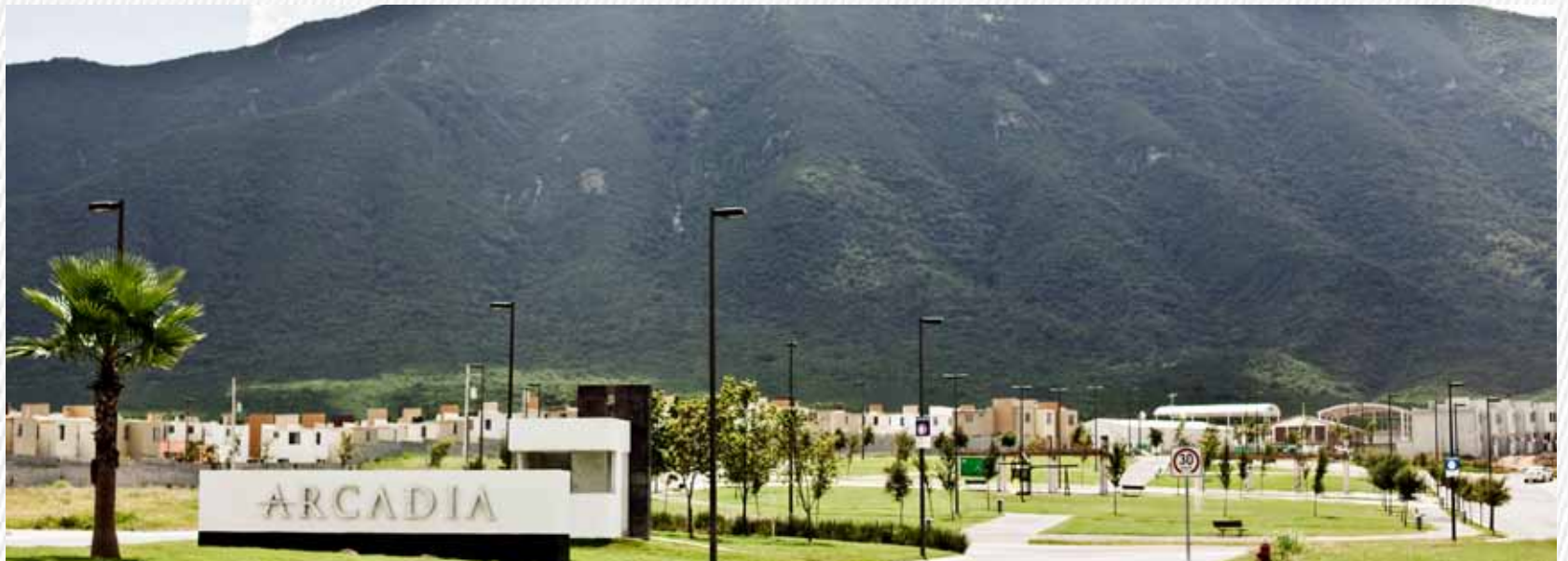
Fraccionamiento Arcadia (Villa de Juárez, NL)

We currently have presence in: Nuevo León, Tamaulipas and Coahuila.