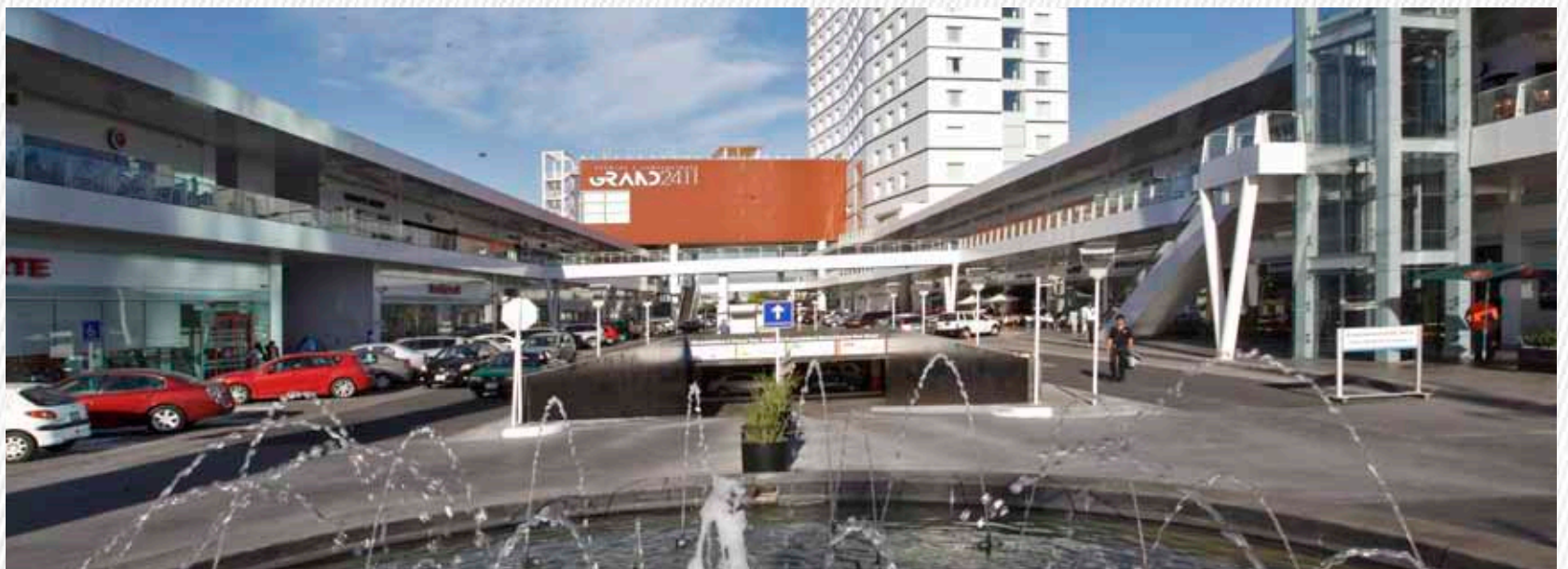
Plaza Comercial Paseo Tec (Monterrey, NL)